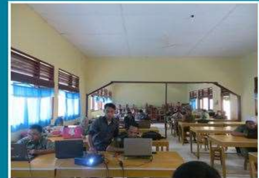
Bimtek Kab. Aceh Tenggara Kab. Aceh Tenggara